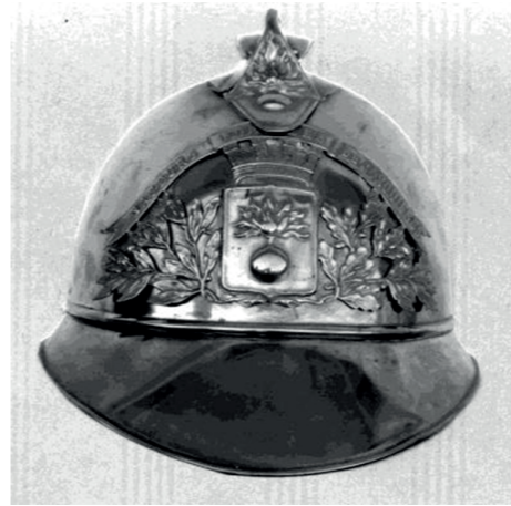
Casque de pompier conservé par un Jonquiérois

Dans les archives municipales de Jonquières, une circulaire du sous-préfet, datée du 8 mai 1840, rappelle qu'il est nécessaire d'organiser une Subdivision de Compagnie de Sapeurs-Pompiers volontaires composée de 32 hommes à prendre dans la liste des Gardes Nationaux, et qu'il faut envisager l'achat d'une pompe à incendie (prix : 1200 Frs).