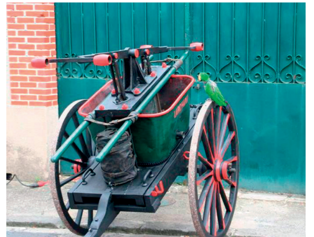
Modèle de pompe à incendie dont il reste des éléments dans la cour de la mairie

Plusieurs arrêtés municipaux vont régulariser cette situation. Celui du 3 août 1851 stipule que les couvertures en chaume, paille ou autre matière combustible sont interdites dans toute l'étendue de la commune. Les cheminées qui ne s'élèvent pas à 1 m 63 au-dessus de la toiture devront être élevées à cette hauteur.