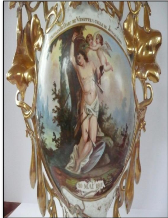
Le vase de 1861 conservé à la mairie – Détail de la partie arrière avec St Sébastien