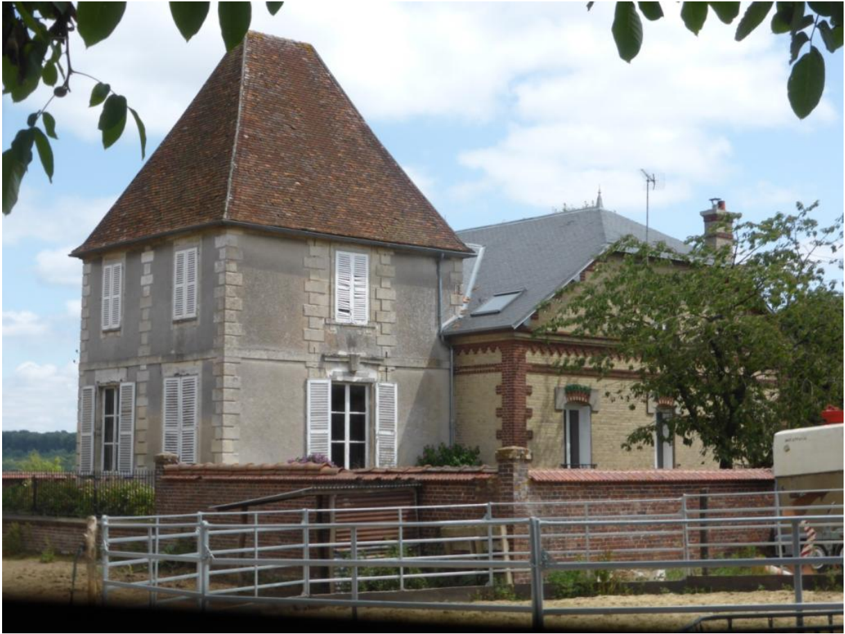
Vue actuelle du château de Jonquières (PPHJ)

Valentin Conrart (1603-1675), est un homme de lettres français, initiateur du projet de l'Académie française dont il fut le premier secrétaire. Beau-frère de Jean de Dompierre, il effectue entre 1632 et 1673 plusieurs séjours au château de Jonquières . Ce château est occupé, dès 1524, par les seigneurs de Dompierre.