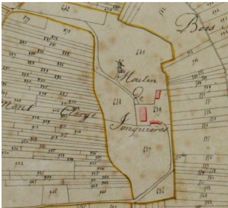
Extrait du cadastre de 1813